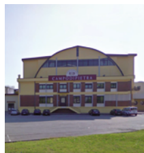
Lungo il percorso